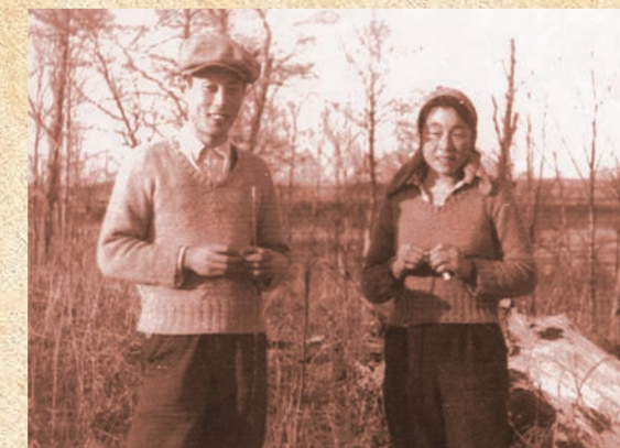
▲ 1931年開墾前の原野を背景に現・会長の両親(先代)

食品加工にかかわりのある家庭に育ったこともあり、お互いに美味しいものにたいへん興味を持っていました。そして家族とともに自分たちの独自の生活文化を築いていきました。