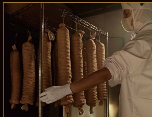
▲ 1本1本綿布を手で巻き、薪と炭火でじっくりと燻煙