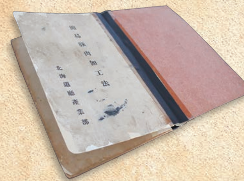
代々受け継がれてきた 1920年代にドイツで発行された本を 北海道庁が翻訳したものを。

こうして、遠い昔の牧場時代から家族で作ってきた自家用品は1986年ホテルのシェフの要請をきっかけに製品化することになったのです。