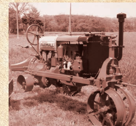
▲ 開拓時期から22年間活躍した、アメリカ初期型のトラクター